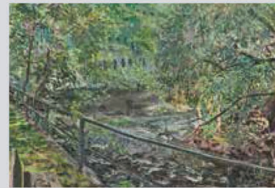
Le Barrage. Normand Lebel

Collection accessible à l'année Lundi au vendredi, de 9 h à 16 h 819 477-2230