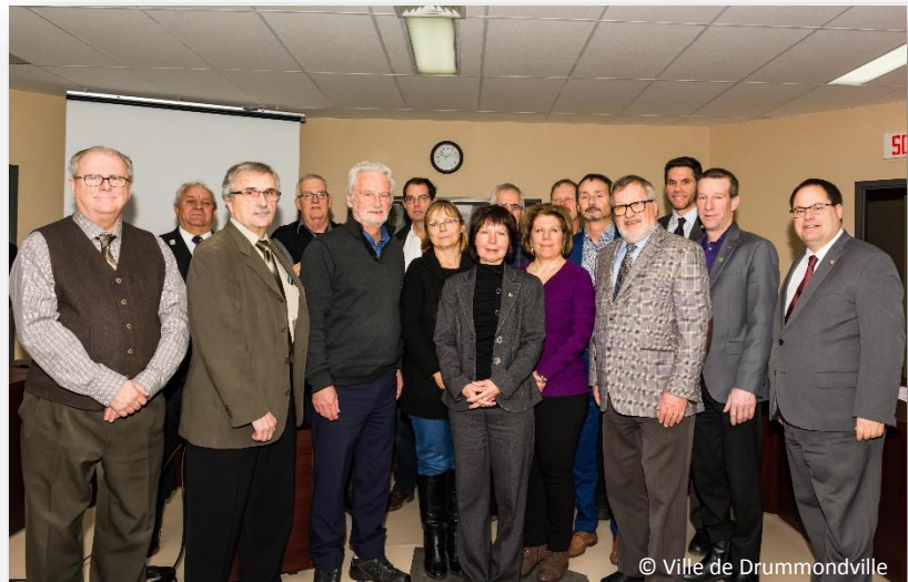
Signataires de la charte, 9 décembre 2016