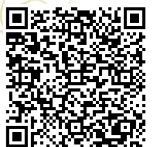
NUMÉRISER POUR VISUALISER LA CARTE INTERACTIVE